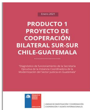
Foto de portada del estudio

La Unidad de Investigación y Coordinación prestó asesoría técnica a Guatemala, específicamente a la Instancia Coordinadora de la Modernización del Sector Justicia (ICMSJ), integrada por Organismo Judicial, a través de su Presidente; Fiscal General de la República; Director del Instituto de la Defensa Pública Penal; Ministerio de Gobernación y El Director General del Instituto para la Asistencia y Atención a la Víctima del Delito.