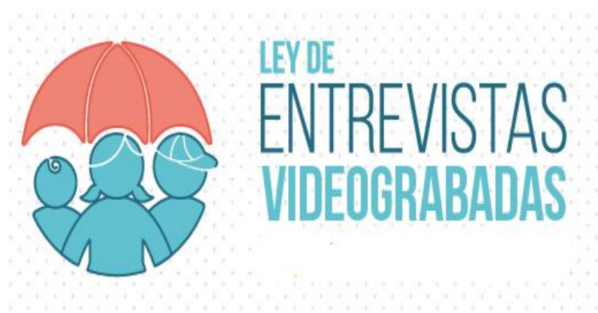
Imagen MINJU Ley. N° 21.057.

El 3 de octubre de 2019, entró en vigencia la Ley N° 21.057 que Regula Entrevistas Grabadas en Video y, Otras Medidas de Resguardo a Menores de Edad, Víctimas de Delitos Sexuales. Esta ley contempla una entrada en vigencia gradual, estableciendo tres etapas, la primera considera las regiones de Arica, Tarapacá, Antofagasta, Maule, Aysén y Magallanes. El principal objetivo de la Ley es prevenir la victimización secundaria de niños, niñas y adolescentes, evitando así toda consecuencia negativa que puedan sufrir con ocasión de su interacción, en calidad de víctimas, con las personas o instituciones que intervienen en las etapas de denuncia, investigación y juzgamiento de los delitos de su catálogo.