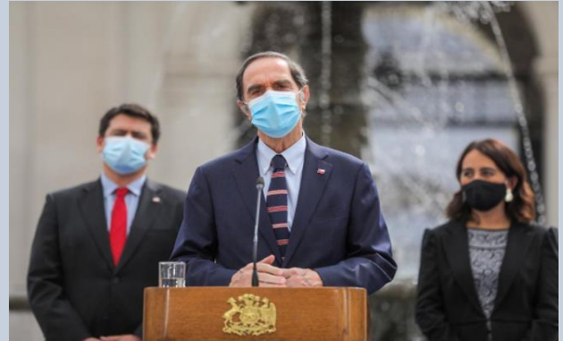
Foto. Presidente Sebastián Piñera y Ministro Hernán Larraín presentan una nueva reforma Procesal Civil.